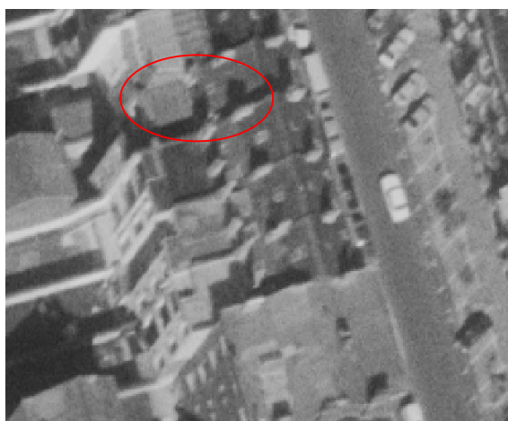
Photo aérienne 1977

Comme mentionné précédemment, la lucarne en façade arrière est présente depuis au moins 1977, comme en attestent les photos aériennes d'archives disponibles. Dès lors, il s'agit d'un élément ancien et existant du bâtiment, antérieur à l'entrée en vigueur des réglementations récentes. Sa régularisation ne nécessite donc pas l'établissement d'un certificat PEB, conformément aux dispositions en vigueur en matière de performance énergétique des bâtiments.