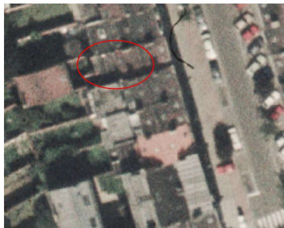
Photo aérienne 1987